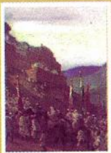
لوحة الغلاف للفنان Jean de la Nézière